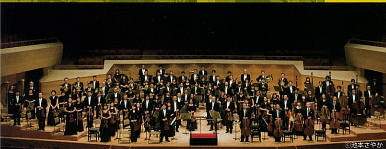
Tokyo Metropolitan Symphony Orchestra